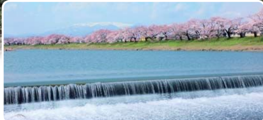
桜絶景スポットの「葦神堰」は現在改修工事のため、 架台が設置されており、近づけません。 ※画像は改修工事前のものです。