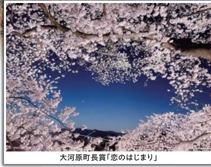
大河原町長賞「恋のはじまり」