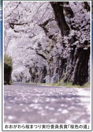
おおがわら桜まつり実行委員長賞「桜色の道」