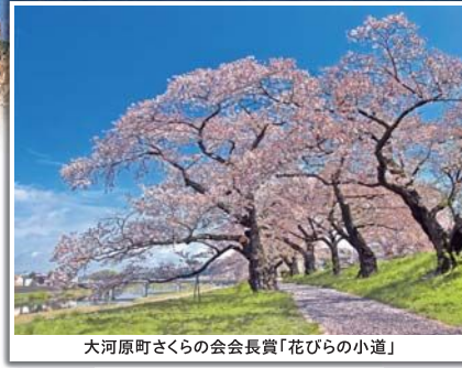
大河原町さくらの会会長賞「花びらの小道」