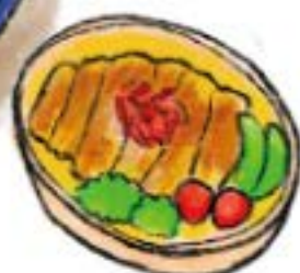
冷めても美味しい かつ丼はお弁当にも。

自慢のかつをふんわりと卵でとじたボリュームたっぷりな一品です。 かつと卵とタレがからみあい ご飯が進みます。