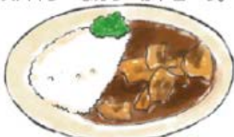
ポークカレーも人気です。

夏はHOTに！いい湯のもちふた カツカレーはいかが？ 揚げたてサクサクのカツに スパイシーなカレーがトロ〜リ。