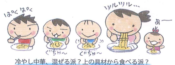
冷やし中華、混ぜる派？上の具材から食べる派？